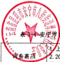
表 3-4 宁波市 2025 年征收农用地区片综合地价更新调整问卷调查表