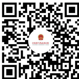
云南省人民政府公报 微信小程序