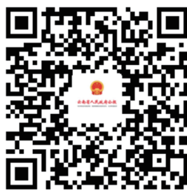
云南省人民政府公报 支付宝小程序