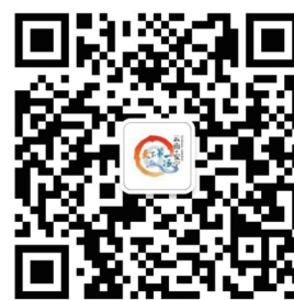
魅力安宁微信二维码